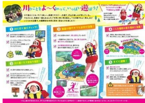
全国の水難事故マップ ((公財) 河川財団 作成)

http://www.kasen.or.jp/mizube/tabid118.html