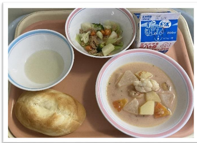
・1/28 (金) ★フランスのだし★ 『ソフトフランスパン・ブイヤベース・ニース風サラダ・だし汁 (フランス)・牛乳』