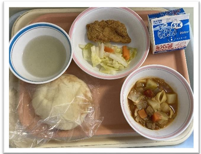
・1/27 (木) ★イタリアだし★ 『フォカッチャ・ミラノ風カツレツ・野菜のマリネ ミネストローネ・だし汁 (イタリア)・牛乳』