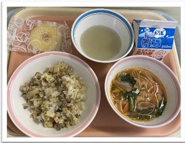
・1/26 (水) ★東南アジアだし★ 『ガパオライス・トムヤムクン・冷凍パイ だし汁 (東南アジア)、牛乳』