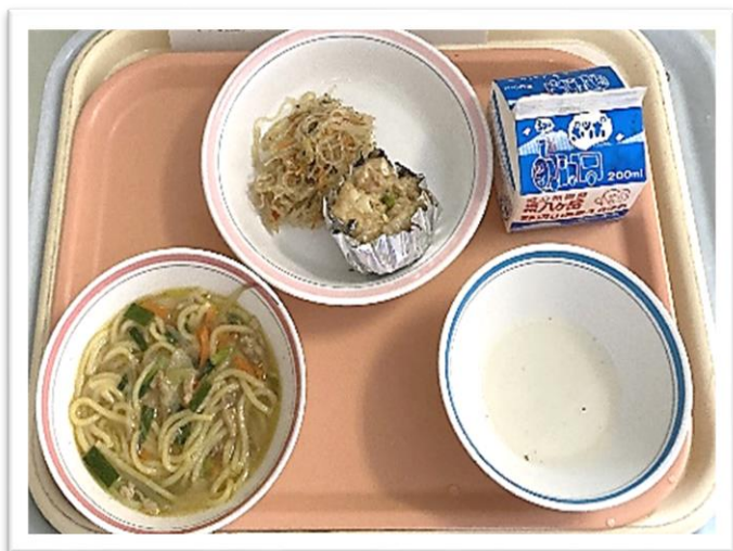
・1/24（月） ★中国のだし★ 『ヤンシュン麺・ジャンボしゅうまい・パンサンヌー だし汁（中華だし）・牛乳』